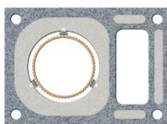
proBIT Einzügig mit Schacht für Raumlufunabhängigen Betrieb oder als Installationsschacht