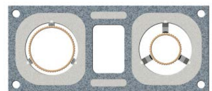
proBIT Zweizügig kombiniert mit zwei unterschiedlichen Durchmessern zum Anschluss verschiedener Feuerstätten. Zusätzlich mit Schacht für Raumlufunabhängigen Betrieb oder als Installationsschacht